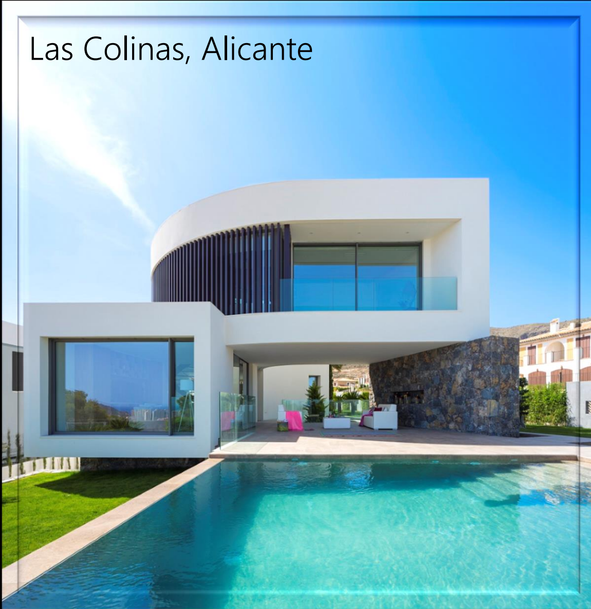
Las Colinas, Alicante